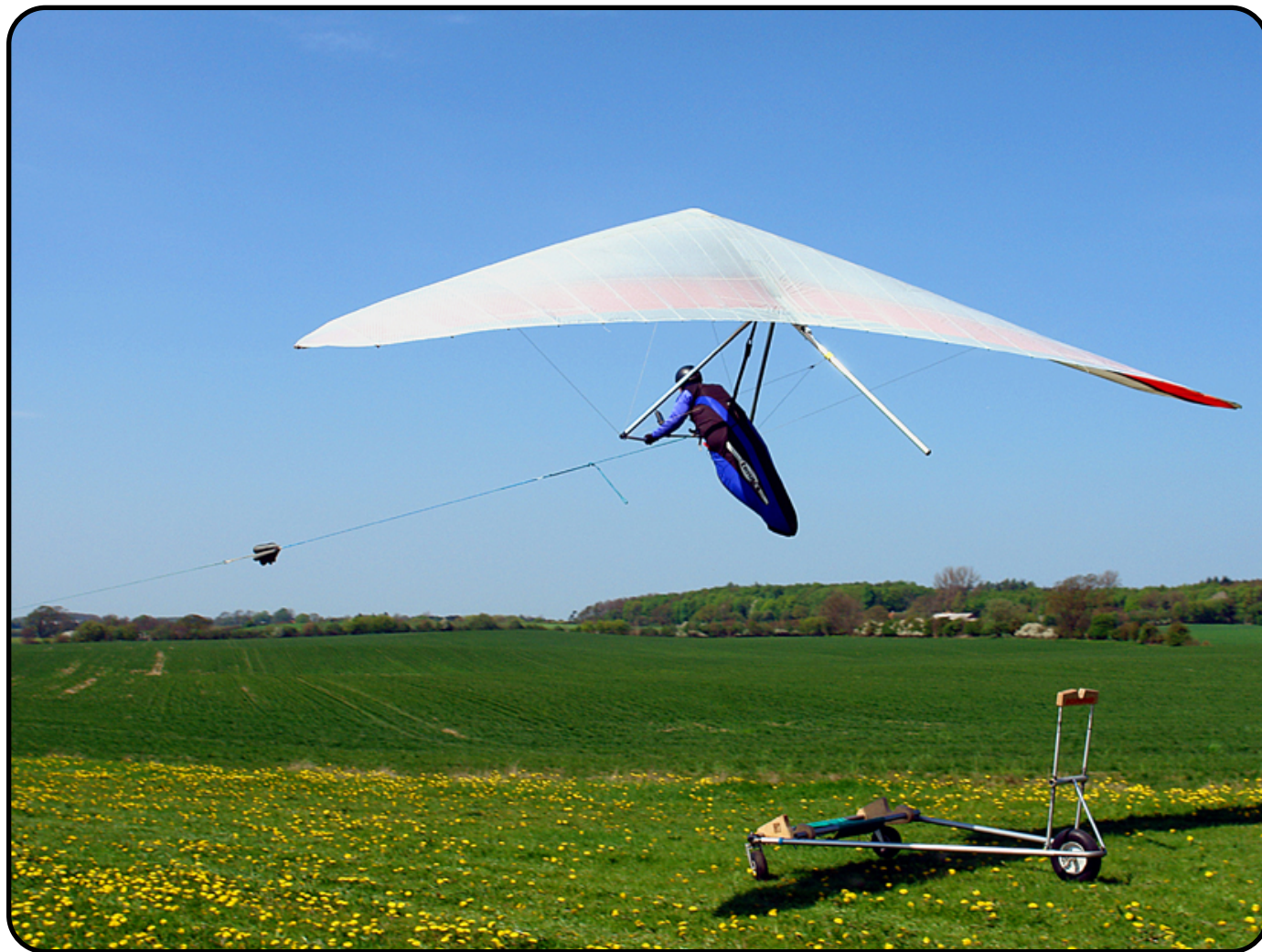
Optræk i forbindelse med distanceflyvning

Et moderne dragefly (hangglider) er et højtydende og avanceret svæveplan med et vingspænd på 10 m. I forbindelse med distanceflyvning foretages optræk – ligesom med et svævefly – til en højde på 450 m.